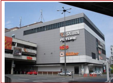
Kfm. Due Diligence-Prüfung